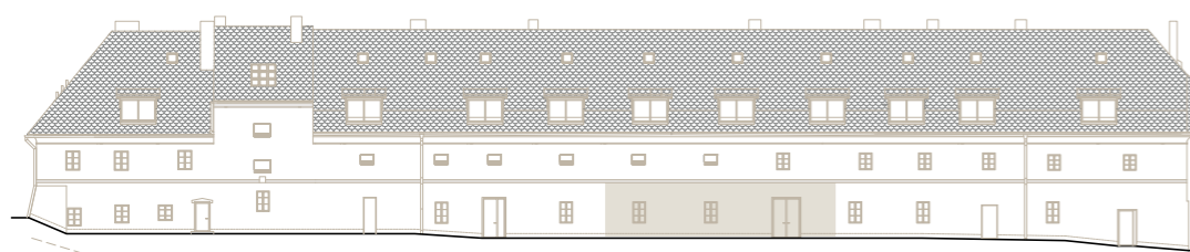
budova A (jižní křídlo) – pohled z ulice