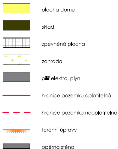
SCHÉMA UMÍSTĚNÍ V LOKALITĚ