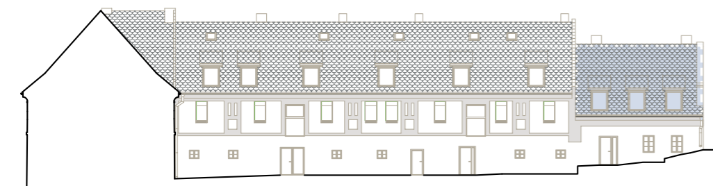
budova B (západní křídlo) – pohled z vnitrobloku pozn.: byt je situován z druhé strany budovy