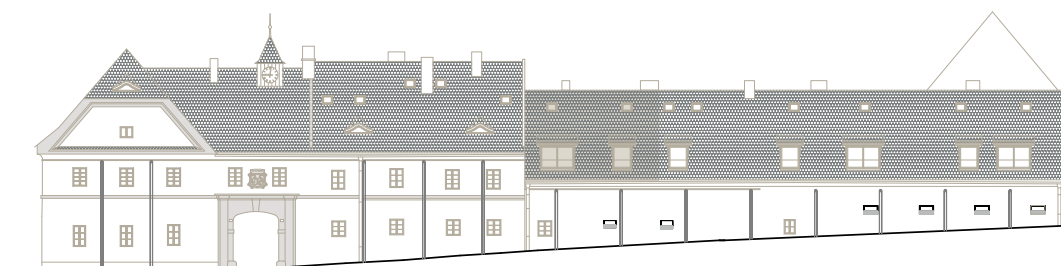
budova E (východní křídlo) – pohled z ulice