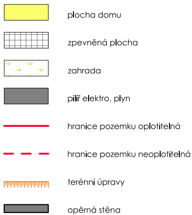
SCHÉMA UMÍSTĚNÍ V LOKALITĚ