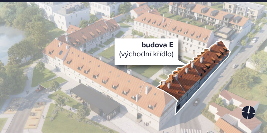
budova E (východní křídlo)