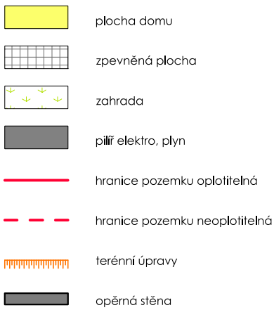
SCHÉMA UMÍSTĚNÍ V LOKALITĚ